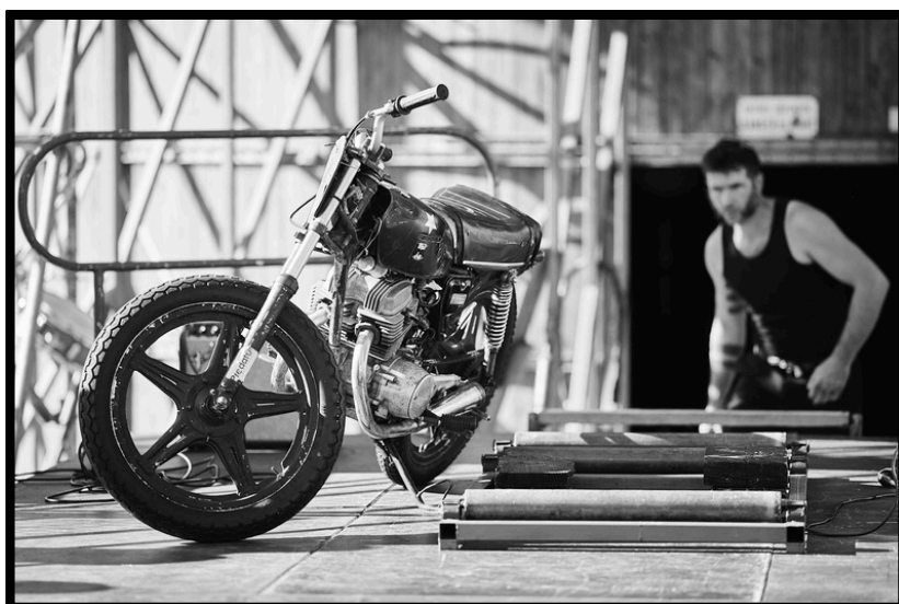
Festival Multi-Pistes Nexon - 2024