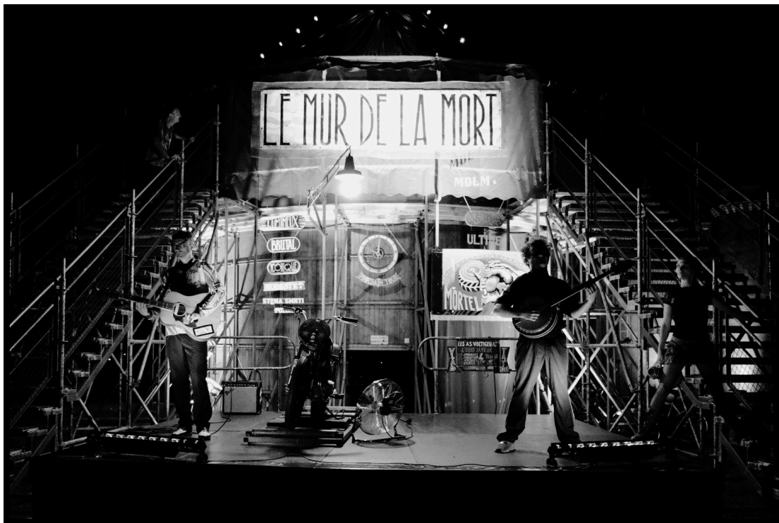
Festival Multi-Pistes Nexon - 2024