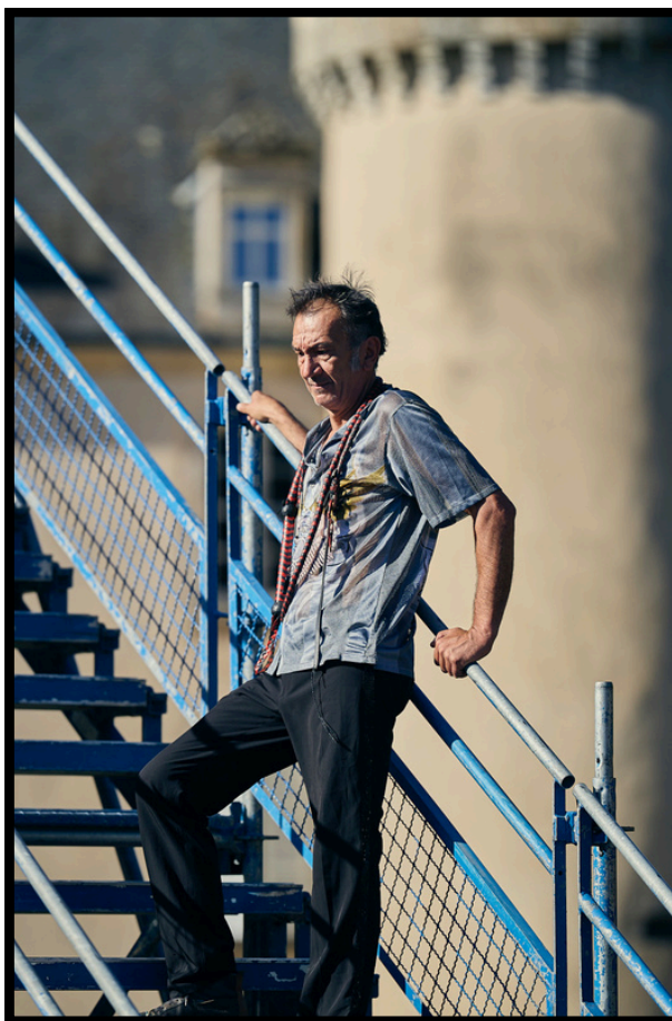
Festival Chalon dans la Rue et Festival Multi-Pistes Nexon