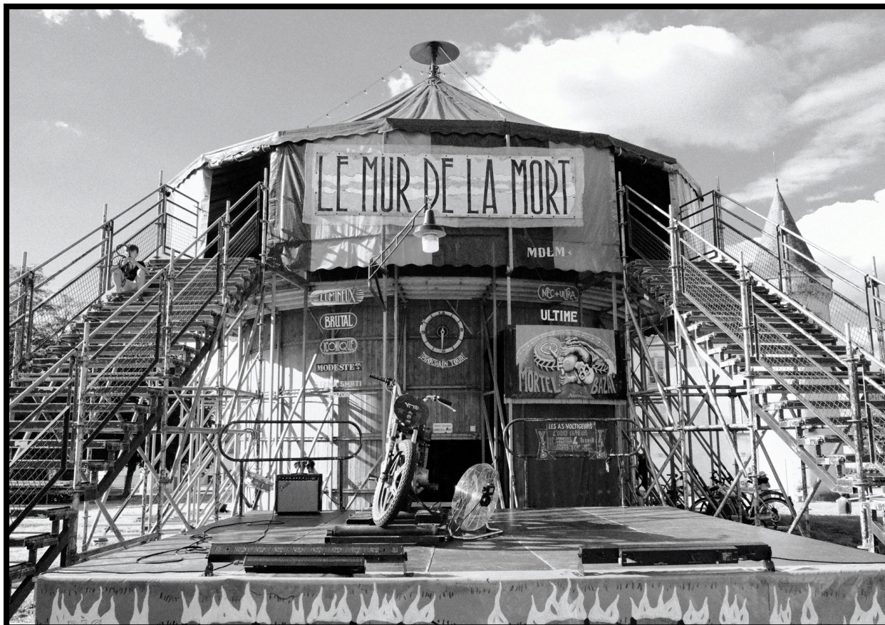
Festival Multi-Pistes Nexon - 2024

On y triche pas, c'est un Mur de la Mort.