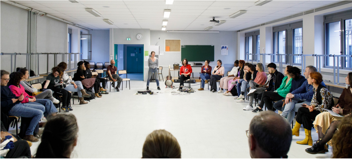
Veillée au lycée Gay Lussac de Limoges / Zébrures du printemps 2023