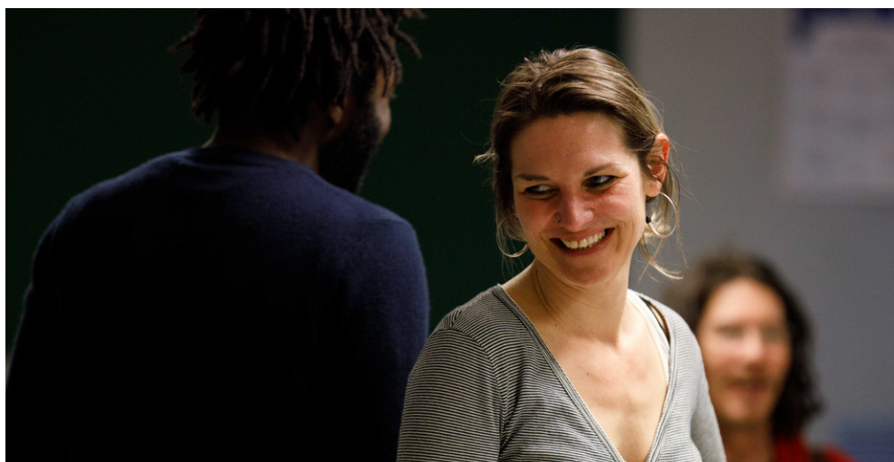
Veillée au lycée Gay Lussac de Limoges / Zébrures du printemps 2023